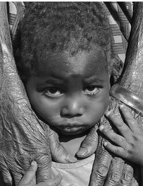
In Sambia trifft die Immunschwächekrankheit zunehmend die Kinder.

In Sambia sterben inzwischen fast 100.000 Menschen im Jahr an AIDS. Eine Million sind infiziert, darunter 100.000 Kinder. Sie haben sich fast alle bei ihren HIV-positiven Müttern angesteckt. Ihre Überlebenschancen sind sehr gering, da die wenigsten medizinisch behandelt werden. Kaum eines wird älter als fünf. Darüber hinaus haben schon 630.000 Kinder durch die Krankheit ihre Mutter oder ihren Vater verloren. Viele Waisen leiden unter Diskriminierung - denn AIDS ist in Sambia noch immer ein Tabu. UNICEF hilft, die Versorgung HIV-positiver Kinder zu verbessern. UNICEF unterstützt zudem die Aufklärungsarbeit unter Jugendlichen und richtet mobile Gesundheitsstationen ein, um Familien in entlegenen Gebieten versorgen zu können.