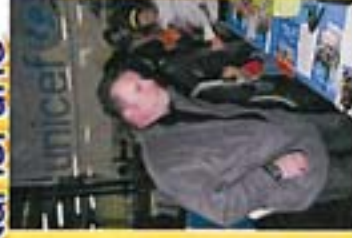
Schirmherr „Prinz Henri“